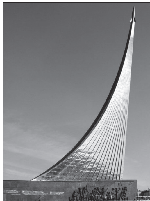
Рис. 5. Монумент покорителям космоса

Интересно, заложена ли формула Циолковского в этот монумент или это случайное совпадение? Но сам Циолковский в виде памятника присутствует у подножия монумента.