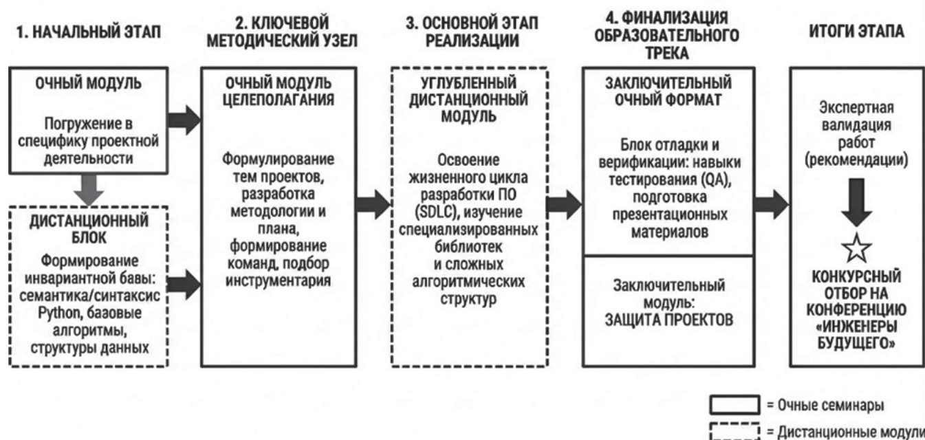
Рис. 2. Структурно-содержательная модель программы курса «Разработка приложений» в первый год ее осуществления (пилотный год)