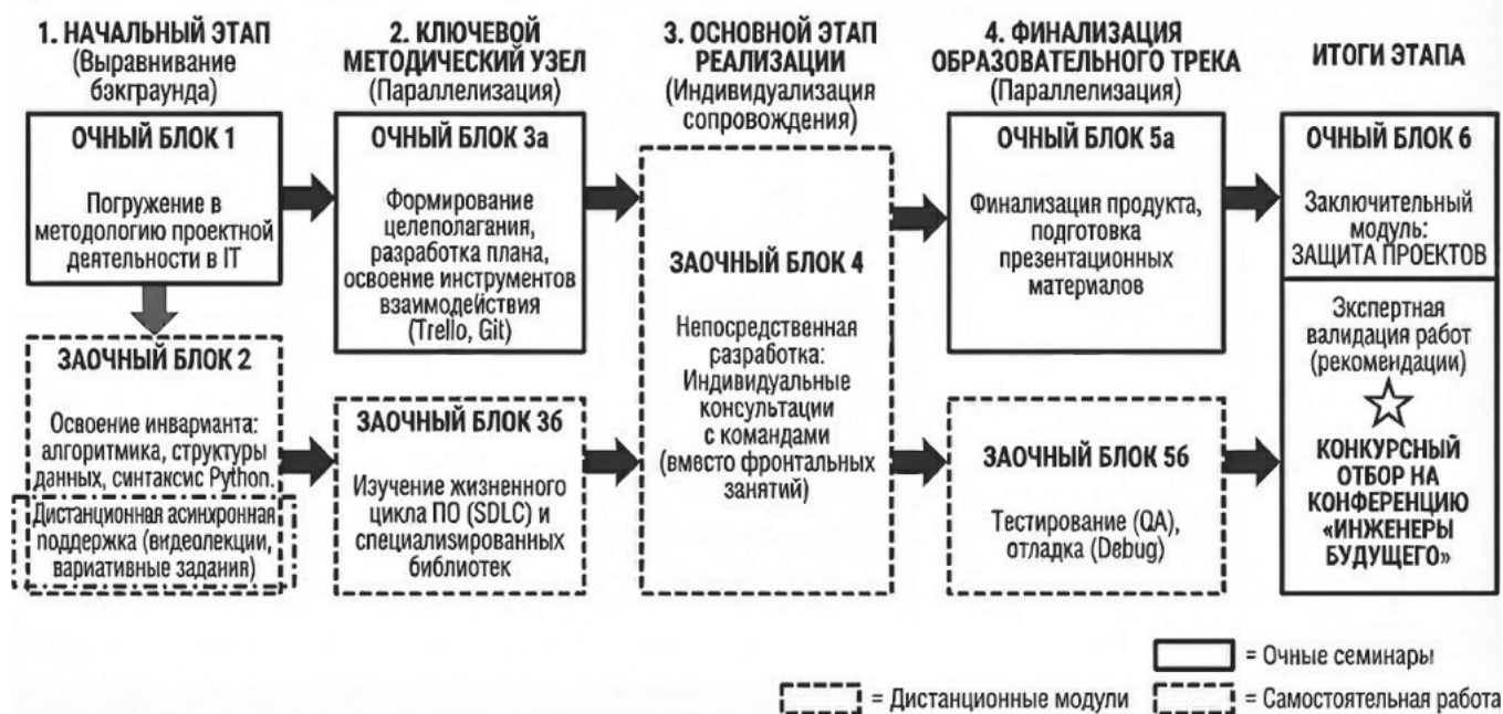
Рис. 3. Структурно-содержательная модель обновленной программы курса «Разработка приложений»