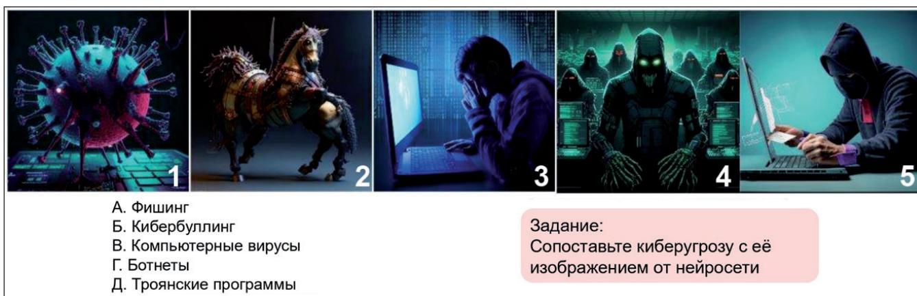
Рис. 3. Задание по цифровой грамотности для урока информатики IX класса