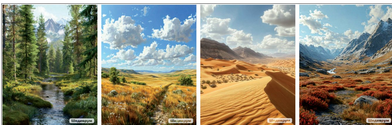
Рис. 2. Изображения, созданные в «Шедевре» для задания на тему «Природные зоны»

информатике (для презентаций и обработки графики) либо иллюстративного материала для презентаций по другим учебным предметам.