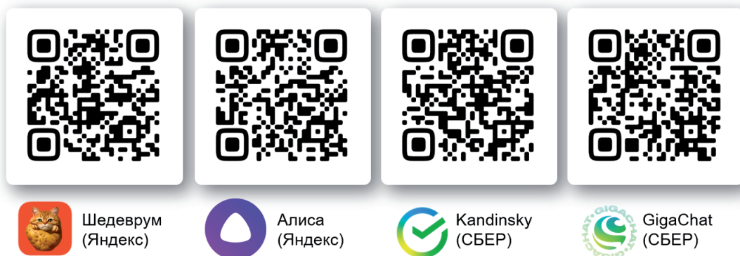
Рис. 5. Российские нейросети и QR-коды со ссылками на их сайты