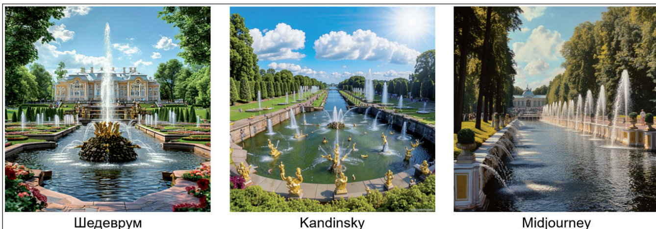
Рис. 1. Результаты работы различных нейросетей по запросу на тему «Петергоф»