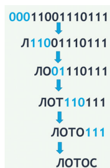
Рис. 1. Пояснение к решению задачи на декодирование информации «слева направо»

В учебнике дано визуальное пояснение к решению этой задачи (рис. 1), которое пошагово демонстрирует ход рассуждений.