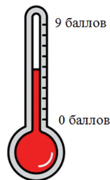
Рис. 1. «Термометр настроения»

На рабочем листе на рисунке с термометром учащиеся фиксируют свое настроение перед началом урока (рис. 1). Прием помогает определить эмоциональное состояние учащихся на уровне ощущений.