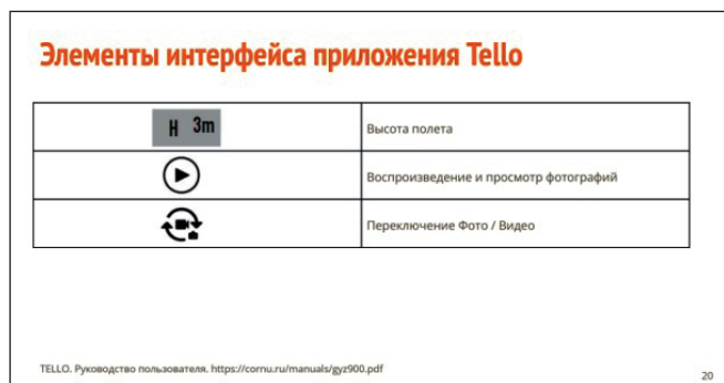
Рис. 5. Слайды презентации, представляющие элементы интерфейса приложения Tello