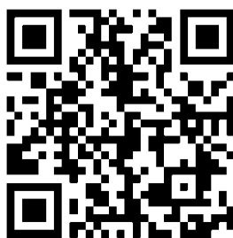
Рис. 8. QR-код — ссылка на электронную доску