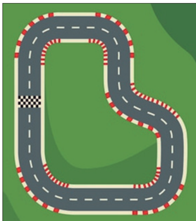
Рис. 6. Схема трассы

Ученик нажимает кнопку «+» и добавляет пост с ответом на доску.