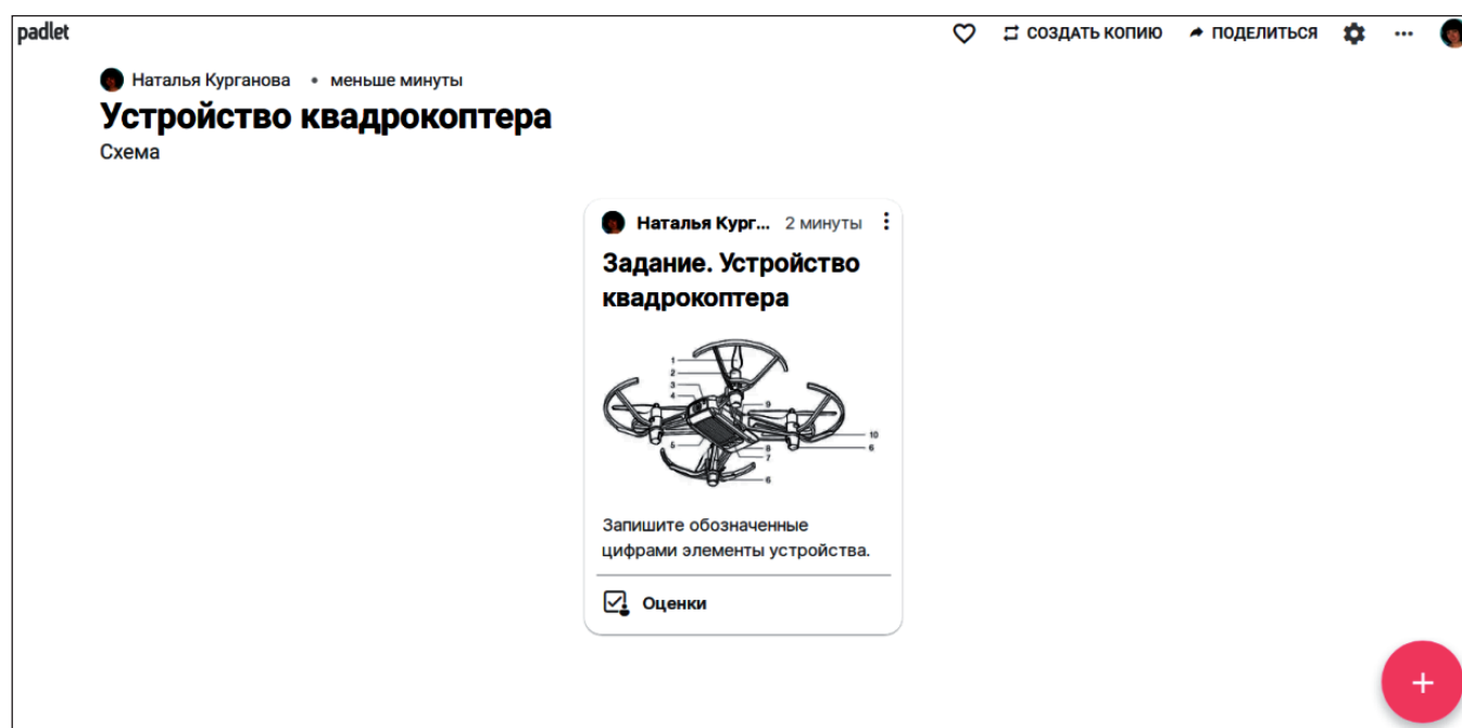
Рис. 7. Пример домашнего задания на электронной доске Padlet

https://cornu.ru/manuals/gyz900.pdf [10].