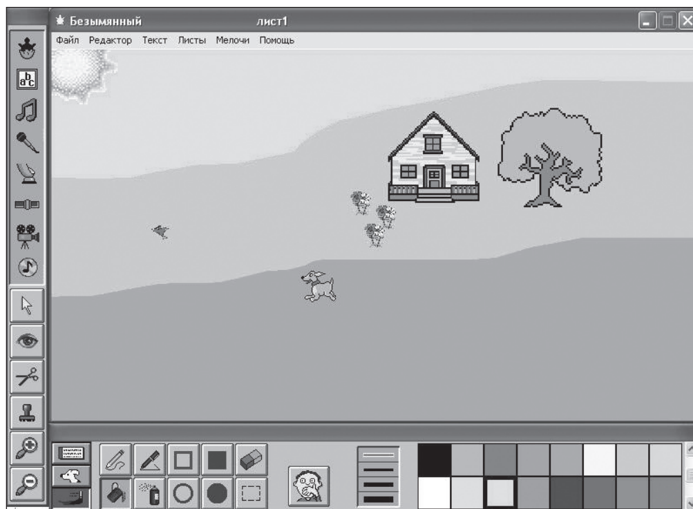
Рис. 1. Исполнитель Черепашка

ются в среде «ЛогоМиры», которая представляет собой систему программирования с языком Logo, а в качестве исполнителя выступает Черепашка (рис. 1).