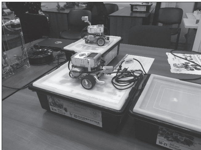
Фото 2. Робототехнический набор

Обучение программированию и освоение принципов создания алгоритмов может быть разным. Но включение в учебный процесс робототехнических комплексов и комплектов позволяет одновременно решить целый