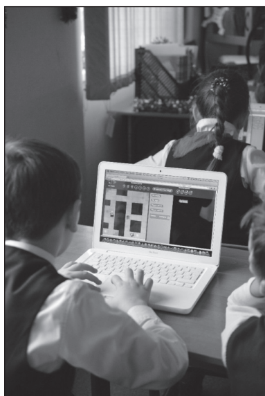
Фото 1. Информатика на MacBook

Войдем в школьный класс, оборудованный по последнему слову техники, и спросим у детей, в чем заключается их интерес к уроку информатики (фото 1).