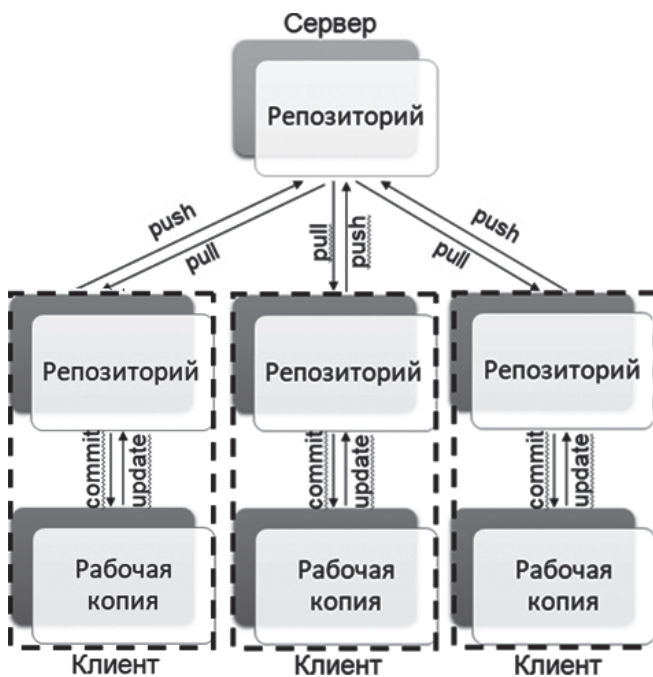
Рис. 2. Схема взаимодействия компьютеров в распределенных системах контроля версий [см. 14].

работают сразу несколько разработчиков, в конце 1980-х годов появились распределенные системы контроля версий (рис. 2).