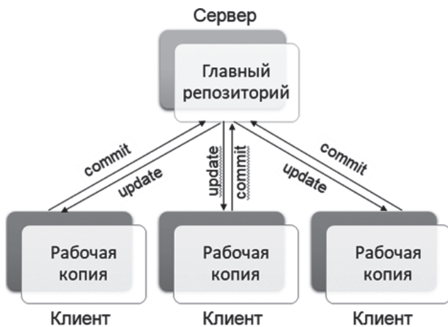
Рис. 1. Схема взаимодействия компьютеров в централизованных системах контроля версий [см. 14]. Commit — команда сохранения состояния проекта в репозитории, update — команда обновления рабочей копии

работают сразу несколько разработчиков, в конце 1980-х годов появились распределенные системы контроля версий (рис. 2).