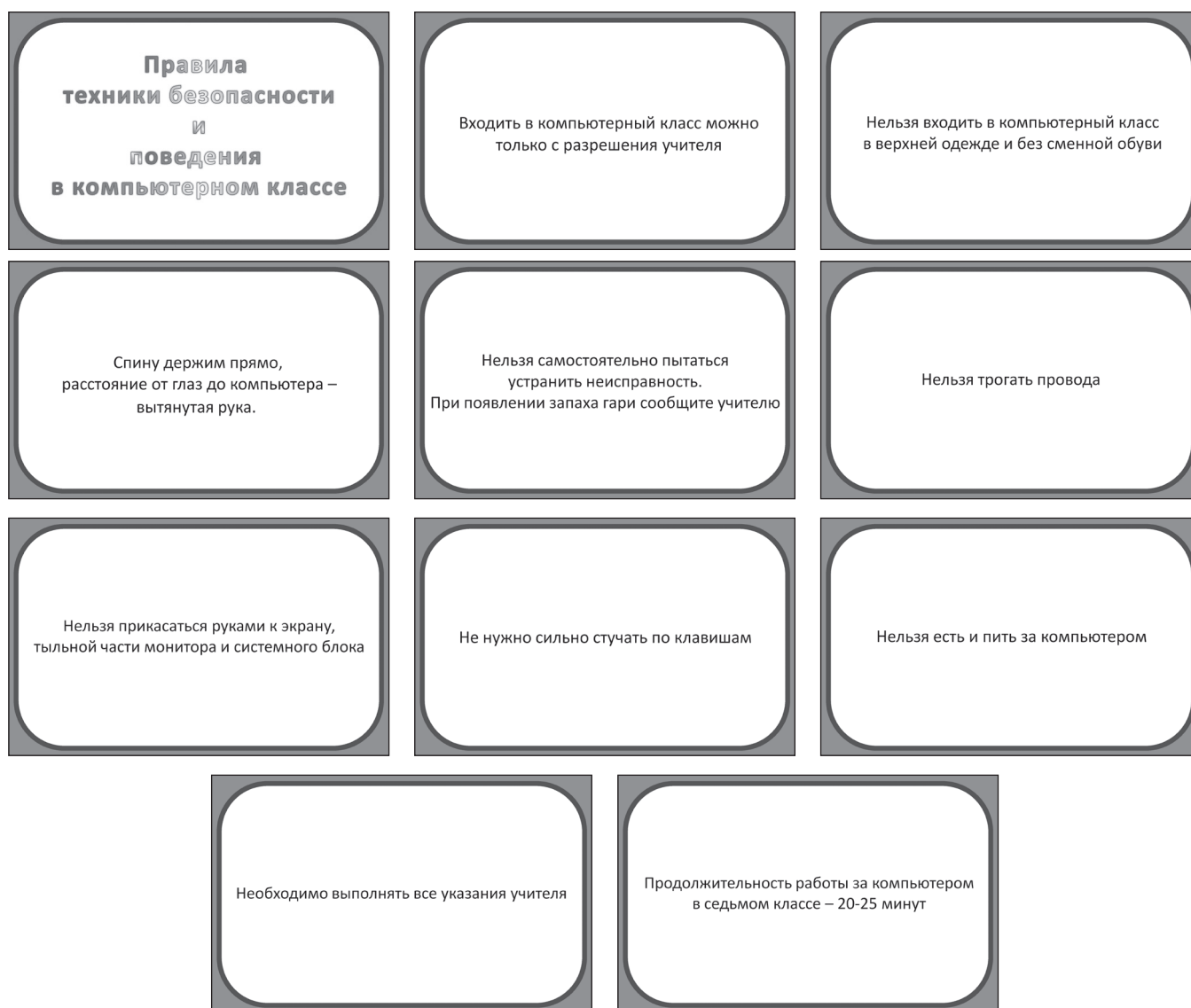
Рис. 1. Пример получившейся презентации «Техника безопасности»

Я уверена, что у вас все может получиться гораздо лучше, чем у меня, и в следующий раз мы будем смотреть не скучную презентацию, а захватывающий ролик — может быть, с вами в главной роли!