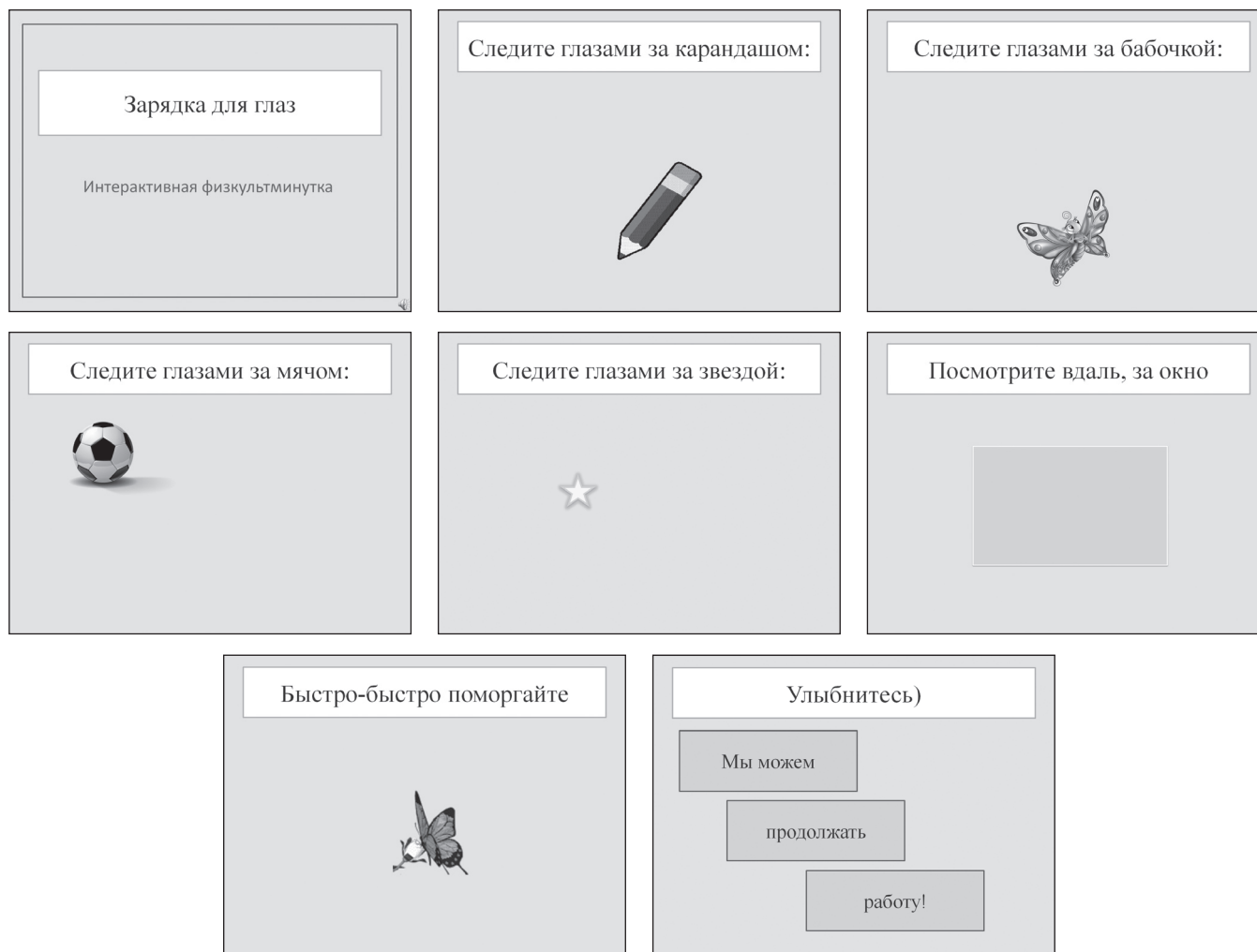
Рис. 2. Интерактивная презентация «Физкультминутка»

Учащиеся запускают на своих компьютерах презентацию для выполнения физкультминутки, на которой им надо глазами отслеживать движение карандаша, бабочки, мяча, звездочки и т. д. (рис. 2).