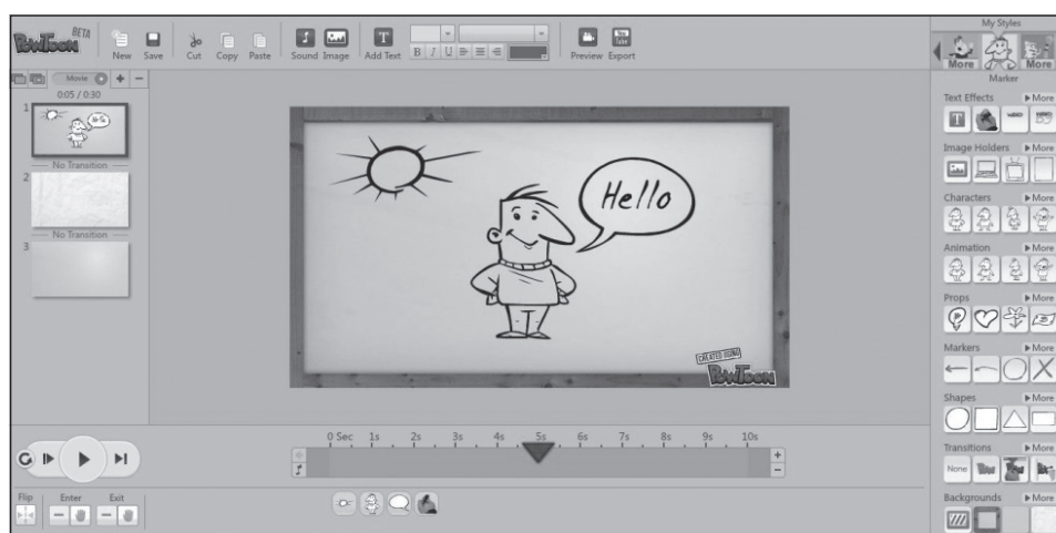
Рис. 1. Рабочая область

В рамках изучения дисциплины «Технические и аудиовизуальные средства» (второй курс, четвертый семестр) студентам предлагается создать короткий видеоролик обучающего характера. Создание видеоконспекта происходит с помощью как предустановленного программного обеспечения, так и онлайн-программных продуктов и сервисов.