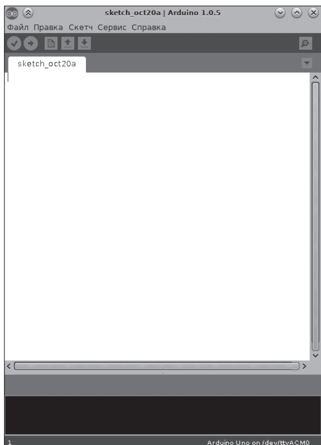
Рис. 1. Окно среды разработки Arduino IDE

В центральную часть среды Arduino IDE пишется программный код — скетч — это текст, понятный человеку и компьютеру (рис. 2). Нажав кнопку Компилировать , вы сможете проверить свой код на правильность. Если внизу окна вы видите надпись «Done compiling» («Компилирование выполнено»), то вы написали все верно. В противном случае вы увидите сообщение об ошибке. Чтобы написанный нами скетч перенесся с компьютера на микроконтроллер Arduino, нужно загрузить его. Это можно сделать при помощи кнопки Upload . Точно так же при удачной загрузке